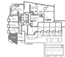
PLAN D'ÉTAGE | KEY PLAN ÉTAGE 2 SECOND FLOOR