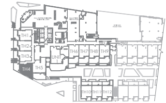
PLAN D'ÉTAGE | KEY PLAN REZ-DE-CHAUSSÉE GROUND FLOOR